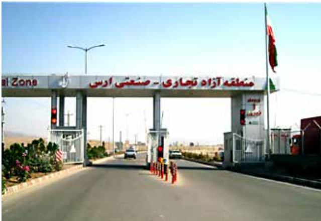
Resim 4: Aras Serbest Bölgesi