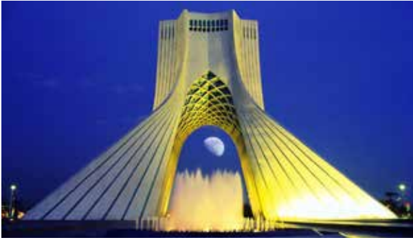
Resim 2: Azadi Meydanı

1979'dan itibaren Türk-İran siyasi ilişkileri genel olarak istikrarlı bir yükseliş çizgisi izlemiştir. Bu hususta, iki ülkenin ortak tarihi ve kültürel paydaları kadar ortak çıkarları ve iyi komşuluk ilişkileri de rol oynamıştır.