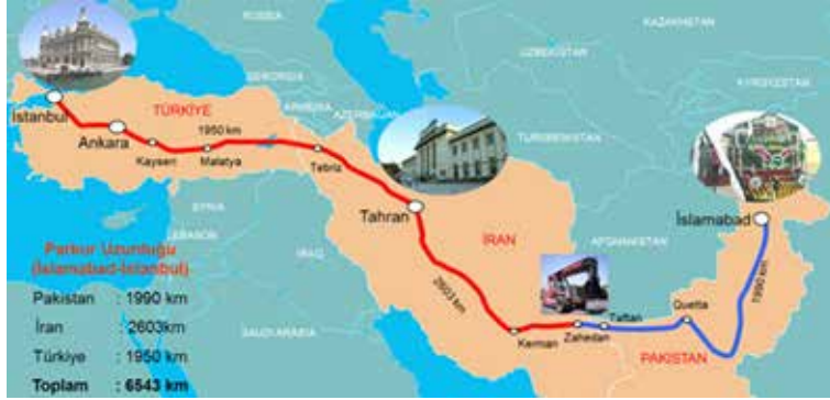
Resim 5: Tahran-İstanbul Yük Treni Güzergahı

Türkiye ile İran arasında demiryolu ile yolcu taşımacılığı, İstanbul-Tahran-İstanbul arasında haftada bir gün çalışan ve kuşetli vagonlardan teşkil edilmiş Trans Asya treni ve Van-Tebriz-Van arasında haftada bir gün çalışan ve I mevkii kuşetli vagon-lardan teşkil edilmiş tren ile sağlanmaktadır.