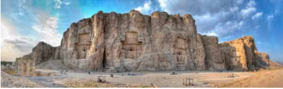
Resim 1: Naqş-ı Rüstem'in Panoramik Görünümü

Daha sonraları İran; Akamenid İmparatorluğu, Part İmparatorluğu ve Sasaniilere ev sahipliği yapmıştır. Ardından gelen Arap istilası ile Sasani İmparatorluğu yıkılmış, Arap hakimiyeti başlamış ve Zerdüştlük yerini İslam dinine bırakmıştır. 1501'de Şah İsmail tarafından kurulan Safavi Hanedanı döneminde İran'ın birliği sağlanmış, İran uygarlığı kültür ve sanatta yükselişe geçmiştir. 1722- 1794 yılları arasında geçen istikrarsız dönemin ardından 1794'ten 1925'e kadar Kaçar Hanedanı ülkeyi yönetmiştir. I. Dünya Savaşı sonrasında Pehlevi Hanedanı kurulmuş, Hanedanlık 1979 yılında gerçekleşen İran İslam Devrimi ile yıkılmış, İran İslam Cumhuriyeti kurulmuştur. 1980-1988 yılları arasında 8 yıl süren İran-İrak savaşında ülkenin ekonomik ve toplumsal yaşamı ağır yaralar almıştır.