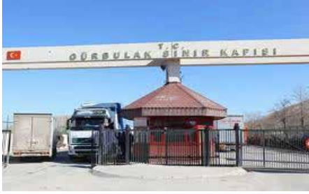
Resim 3: Gürbulak Sınır Kapısı

Türkiye-İran koridorunda yolcu ve yük taşımacılığının en fazla yapıldığı yer, tarihi İpek Yolu üzerinde bulunan Gürbulak Kara Sınır Kapısı'dır. Kapı sadece İran'a değil Orta Asya Türk Cumhuriyetleri, Pakistan, Afganistan ve Çin'e açılmaktadır. Bu nedenle Gürbulak, transit trafiğin ve yük taşımacılığının oldukça yoğun olduğu bir sınır kapısıdır.